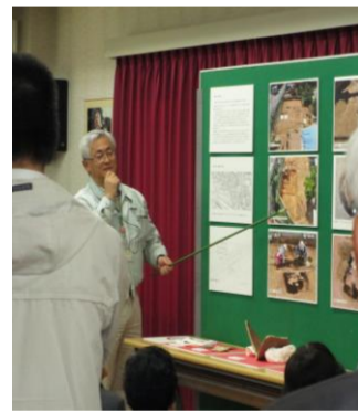
旧佐野家の発掘調査の解説です