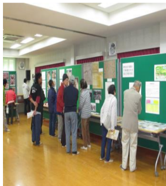
300万年前の古代ゾウの足跡展示