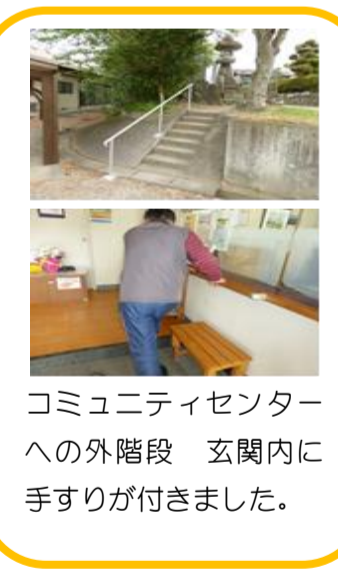
コミュニティセンターへの外階段 玄関内に手すりが付きました。