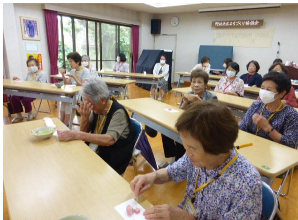
7月のいきいきサロンの様子

今年度も、12月中旬に福祉委員による75歳以上のひとり暮らし高齢者を対象に、あんしん見守り活動を予定しています。皆様のお元気な顔を拝見できますように。