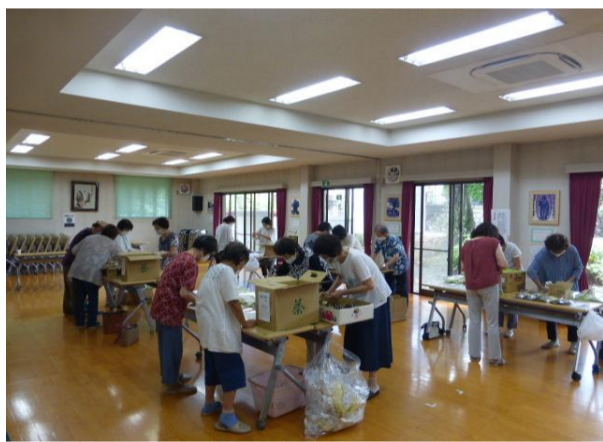
8月28日祝い品配布作業の様子