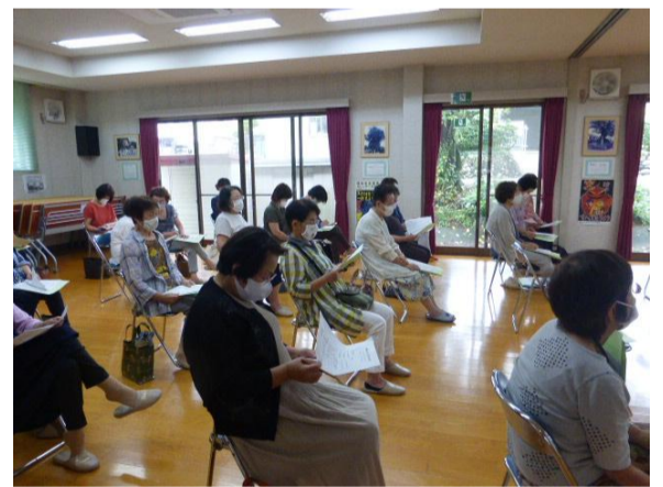
訪問して下さる福祉委員の皆さん