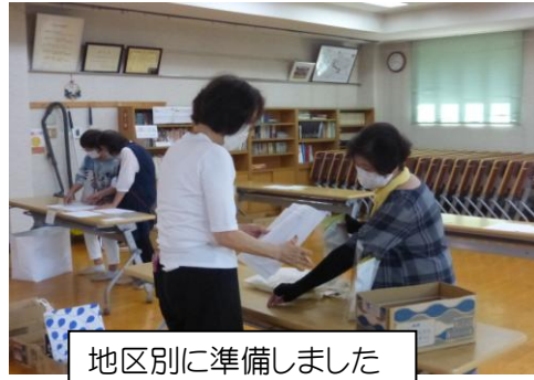
地区別に準備しました