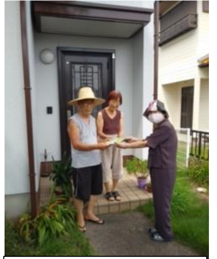
お声掛けしてお渡します

「さつまいももって苗からおいもがでさるの？」 「しっかり土のお布団をかけてあげてね」 初めて経験する親子の姿は、土で手が汚れるのも気にすることなく、心を込めて植えていました。