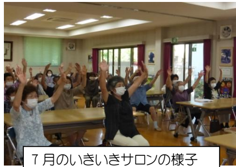
7月のいきいきサロンの様子