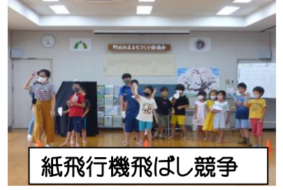
紙飛行機飛ばし競争

夏休み子ども開放DAYの様子 上級生が下級生の宿題を見てあげるほほえましい姿が見受けられました。