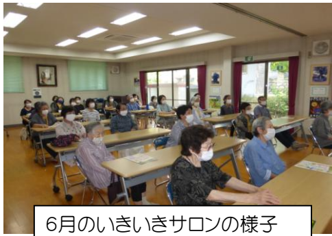
6月のいきいきサロンの様子

敬老の日おめでとございます。これからも健康に留意され、野村地区まちづくり協議会の活動にご支援・ご協力お願いいたします。 健康福祉部