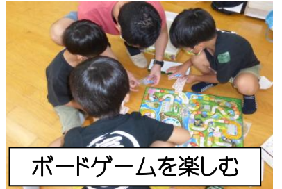
ボードゲームを楽しむ